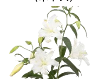
11月 ユリ (切)