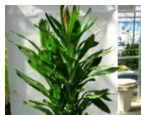
6月 ドラセナ類 (鉢)