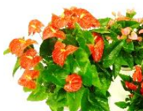
7月 アンズリウム (鉢)