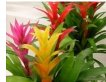
8月 アナス類 (鉢)