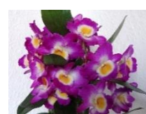
1月 デンドロビウム (鉢)