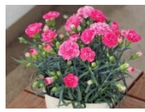
5月 ポットカーネーション (鉢) 〈ポトス〉