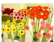
2月 ガーベラ (切)