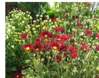
9月 小菊 (切)