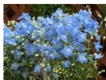
4月 デルフィニウム (切)