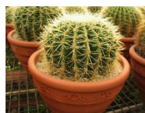
10月 サボテン (鉢)