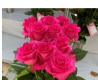
12月 バラ (切)